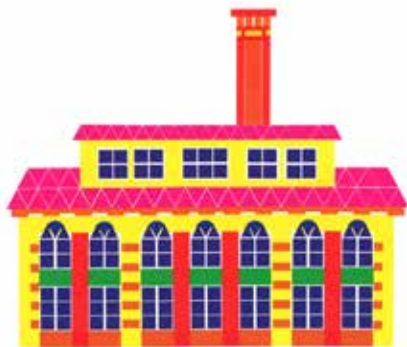
illustration : Mai Li Bernard

Et pour plus d'informations : http://maisonfumetti.fr/